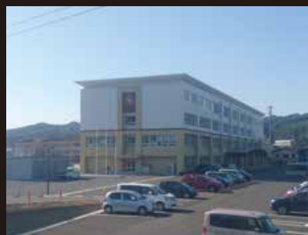
久慈高等学校まで 700m