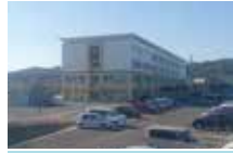
久慈高等学校まで 1,000m